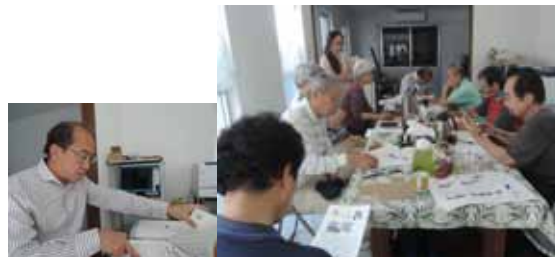
打ち合わせの様子