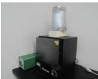
電気炉とアフターバーナー