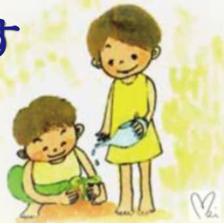
イラスト / 大志多麻衣